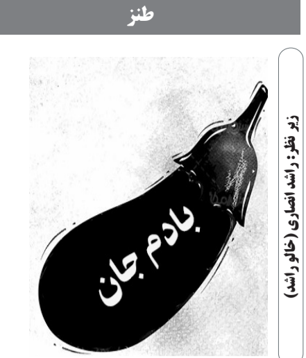
زیو طنز: راشد انصاری (خاک را نش)