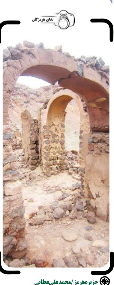
جزیره هرمز / محمدعلی عطایی