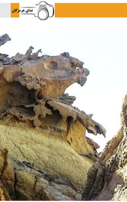
جزیره هرمز

از تخریبها در محیط زیست موثر باشند. این فعال زیست محیطی در ادامه افزود: نمایندگان مجلس وقتی می‌بینند مراتع به آتش کشیده می‌شود و یا محیط زیست در جنگل‌ها به راحتی آلوده می‌شود باید برای افزایش جرائم اقدام و قوانینی جدید تدوین کنند تا مانع ارتکاب بیش تر آن شوند؛ اگر قوانین و جرائم فعلی ما کافی بود ، این وضع کوه و دریا و مراتع ما نبود. مدیر کل سابق محیط زیست مازندران می‌گوید:فراکسیون محیط زیست در مجلس شورای اسلامی، بخش حقوقی سازمان جنگل‌ها و سازمان حفاظت محیط زیست موظف هستند و می‌توانند در اصلاح قوانین جرائم زیست محیطی راسا اقدام کنند و با این قوانین جدید