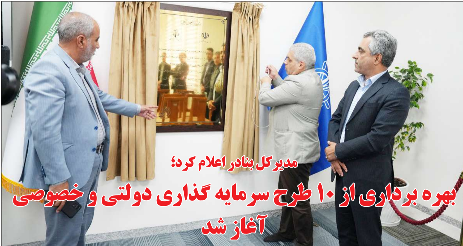
مدیرکل بنادر اعلام کرد؛