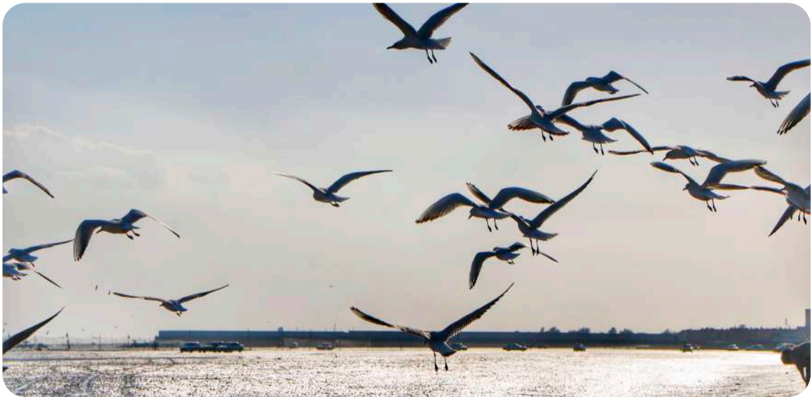
ساحل بندرعباس