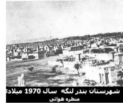
شهرستان بندر لنگه سال 1970 میلاد منظره هوایی

اوج رونق بندر لنگه در دوره زندیه و قاجاریه بوده ، زیرا در این دوران شهر رابط تجاری میان شیراز و خلیج فارس بوده .در دوران قاجاریه بندر لنگه به عرصه اقامت استعمارگران فرانسوی ، بلژیکی و انگلیسی بوده و هما آنها در بندر لنگه کنسولگری داشته اند و گمرک بندر لنگه زیر نظر بلژیکی می شده است.