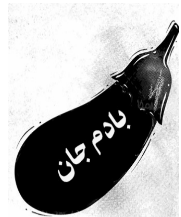
زیر نظر: راشد انصاری (خالو راشد)