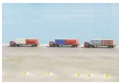
افزایش ۷۸ درصدی ترانزیت جاده‌ای تا پایان اردیبهشت