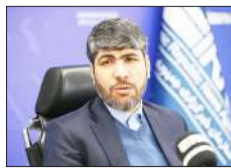
معاون رئیس جمهور: ۵۰ هزار نفر جذب دستگاه‌های دولتی می‌شوند