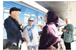
بازدید ۶ میلیون گردشگر خارجی از ایران در یک سال