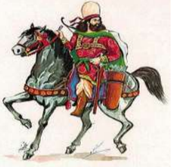
تأثیر آل بویه بر بنادر خلیج فارس