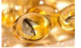
ادعای جدید محققان؛