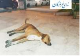
سگ های بی صاحب بندرعباس سامان می یابند