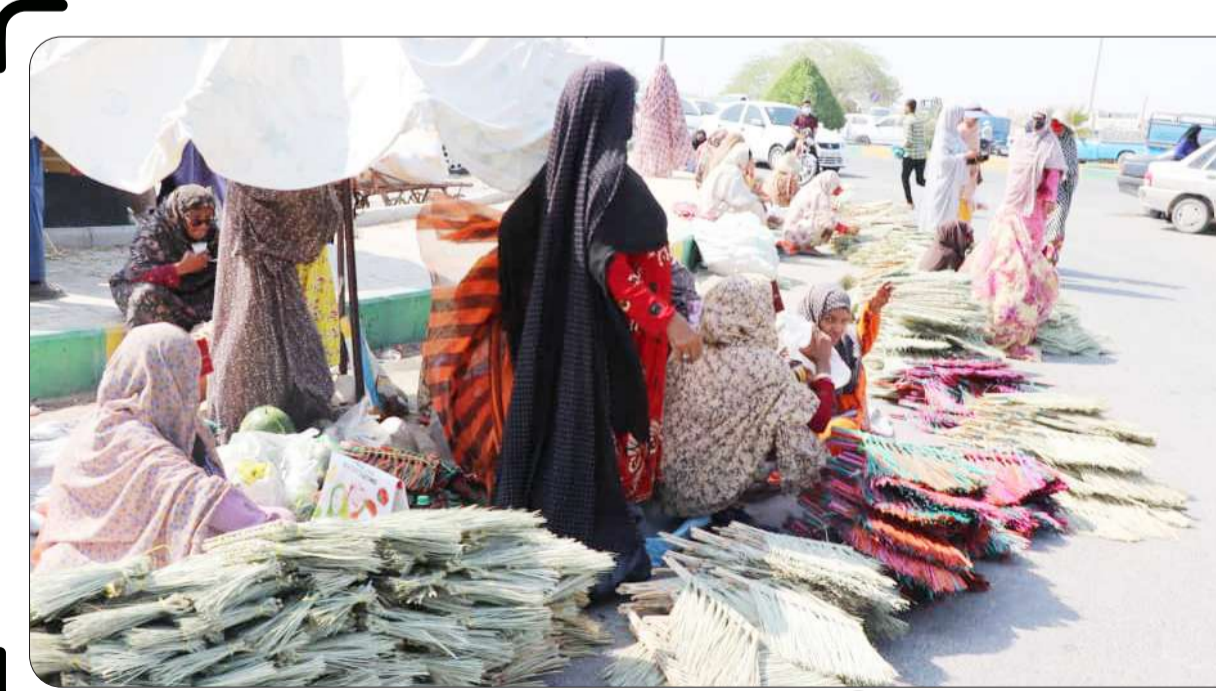
پنجشنبه بازار میناب