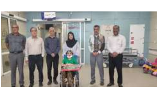
حمایت از کودکان مبتلا به سرطان استان « ساحل خلیج فارس» مشغول به فعالیت می باشیم که فعالیت ما و همکارانمان مورد رضایت خانواده های است که عزیزانشان در این بخش بستری می باشند.

در این دیدار یکی ازدختران تحت درمان از علاقه مندی خود به ورزش پیاده روی و شنا و تأثیر آن در روند سلامتی و درمان صحبت کرد و به دوستان نونهال خود توصیه نمود که به ورزش بپردازند. گفتنی است ، این دیدار با هماهنگی کمیته فرهنگی ومسئولیت های اجتماعی هیات فوتبال استان هرمزگان صورت گرفت.