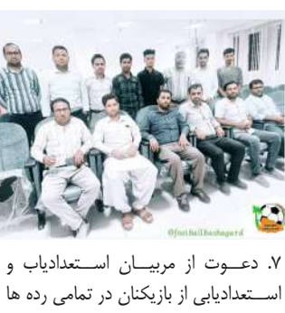
دعوت از مربیان استعدادیاب و استعدادیابی از بازیکنان در تمامی رده ها

به ویژه رده های پایه ۸. فرستادن تیم های برتر شهرستان به مسابقات استانی ۹. پیگیری ثبت باشگاه های ورزشی ۱۰. همکاری با ادارت و نهادهای دیگر جهت توسعه ورزش به ویژه اداره آموزش و پرورش شهرستان و استفاده از ظرفیت دبیران تربیت بدنی مدارس جهت پیشرفت فوتبال پایه