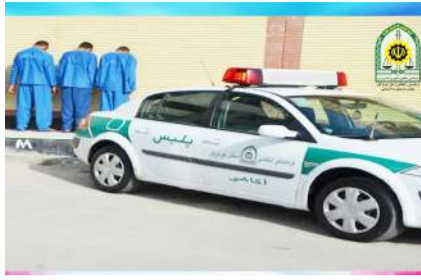
و بافت های قدیمی شهرستان بندرعباس رخ داده که کلیه مجرمین سابقه دار منطقه تحت کنترل قرار گرفته و با