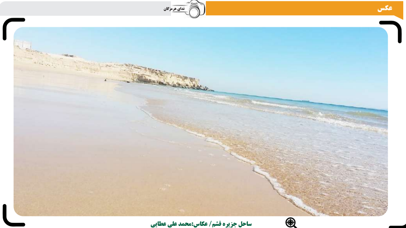
ساحل جزیره قشم

و گشت زنی های نامحسوس محل تخلیه کالای قاچاق را در ساحل محور جاده قشم به سوزا شناسایی و به محل اعزام که قاچاقچیان به محض مشاهده مأموران در ساحل به وسیله قایق به سمت دریانواری مأموران دریابرسی از محل ۲۰ کانتینر سیگار حاوی ۱۰۰۰ پاکت مجموعاً ۲۰۰ هزار نخ سیگار خارجی قاچاق کشف کردند.