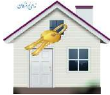
اینفوگرافیک نمای هرمزگان