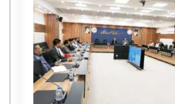
وقت خود را ذخیره کنید

سرپرست معاونت هماهنگی امور عمرانی استانداری هرمزگان اضافه کرد: دانش آموزان با پیروی از قوانین و مقررات و کسب مهارت‌های شهروندی، نقش‌ها و وظایف خود را در قبال جامعه محلی با مشارکت در فعالیتها و برنامه‌های زیست محیطی، فرهنگی، سیاسی و اجتماعی و ... انجام داده و همچنین با رعایت نظم و قانون، احساس تعلق نسبت به جامعه، رفتار همدلانه، محترمانه و مشارکت جوانانه، آن را تثبیت می‌کنند.