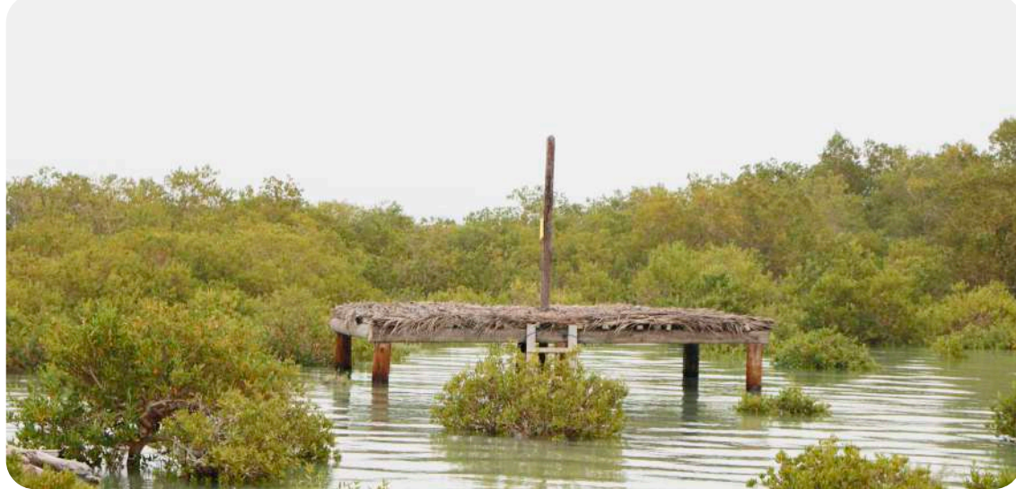
جنگل حرا / قشم