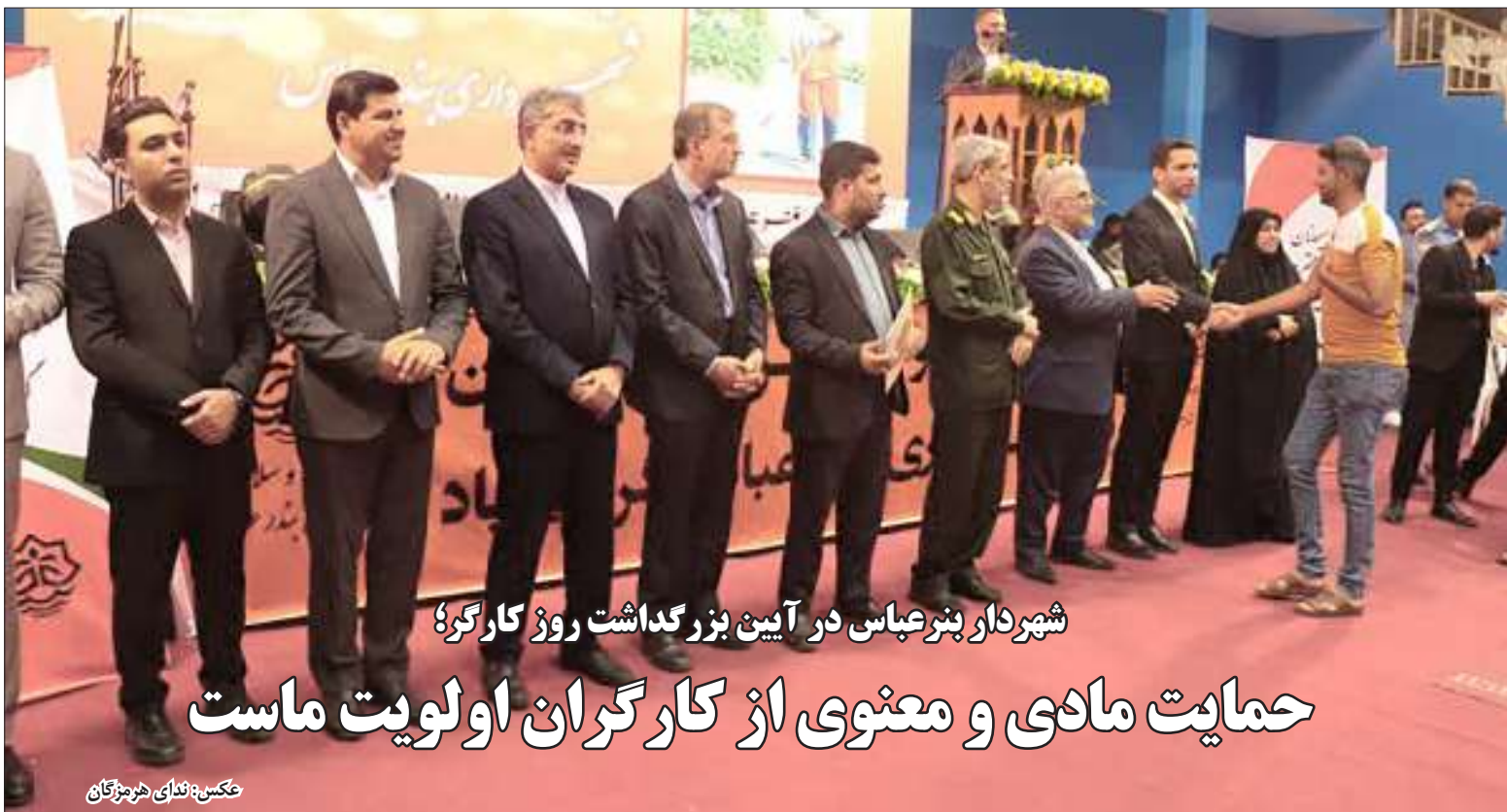
شهردار بندرعباس در آیین بزرگداشت روز کارگر