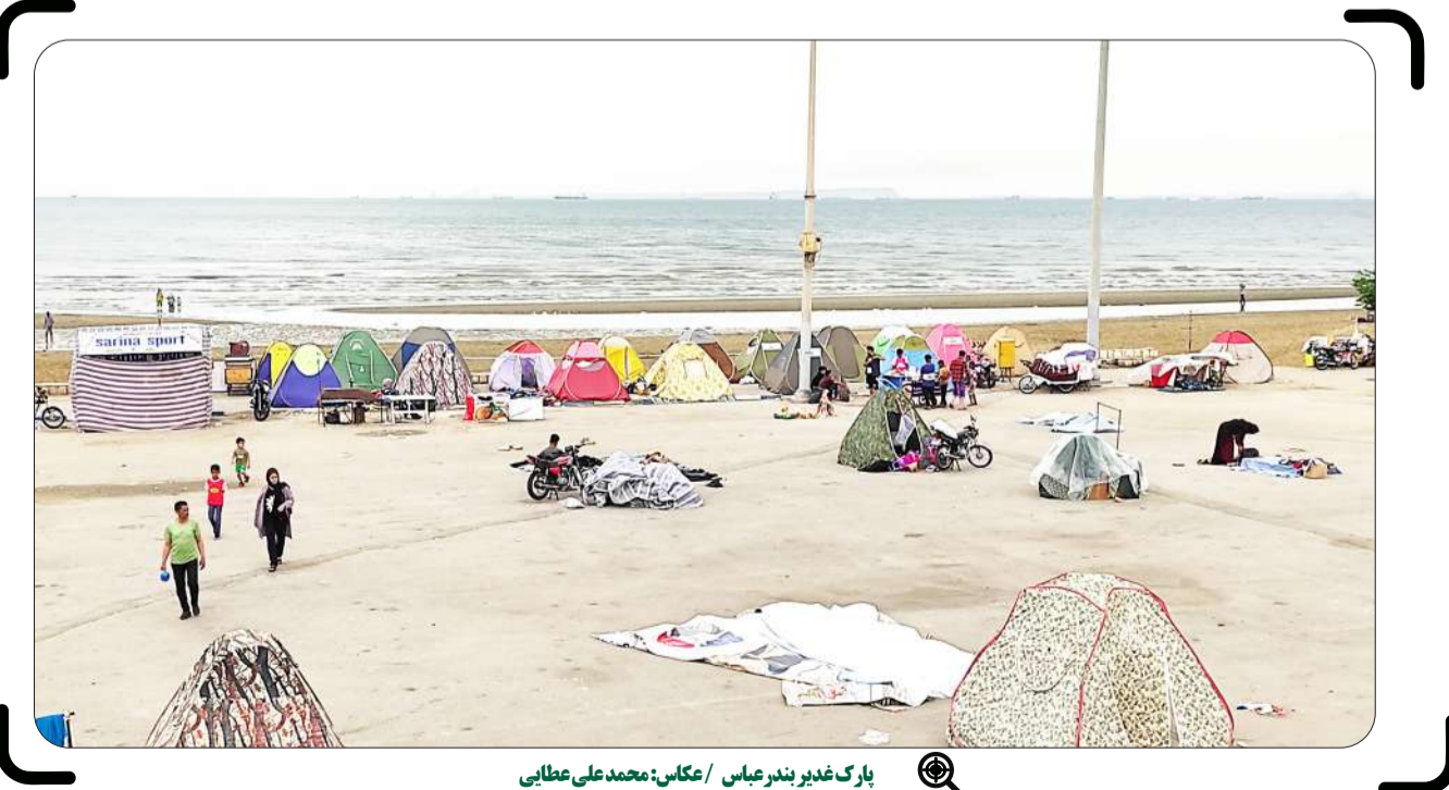
پارک غدیر بندرعباس