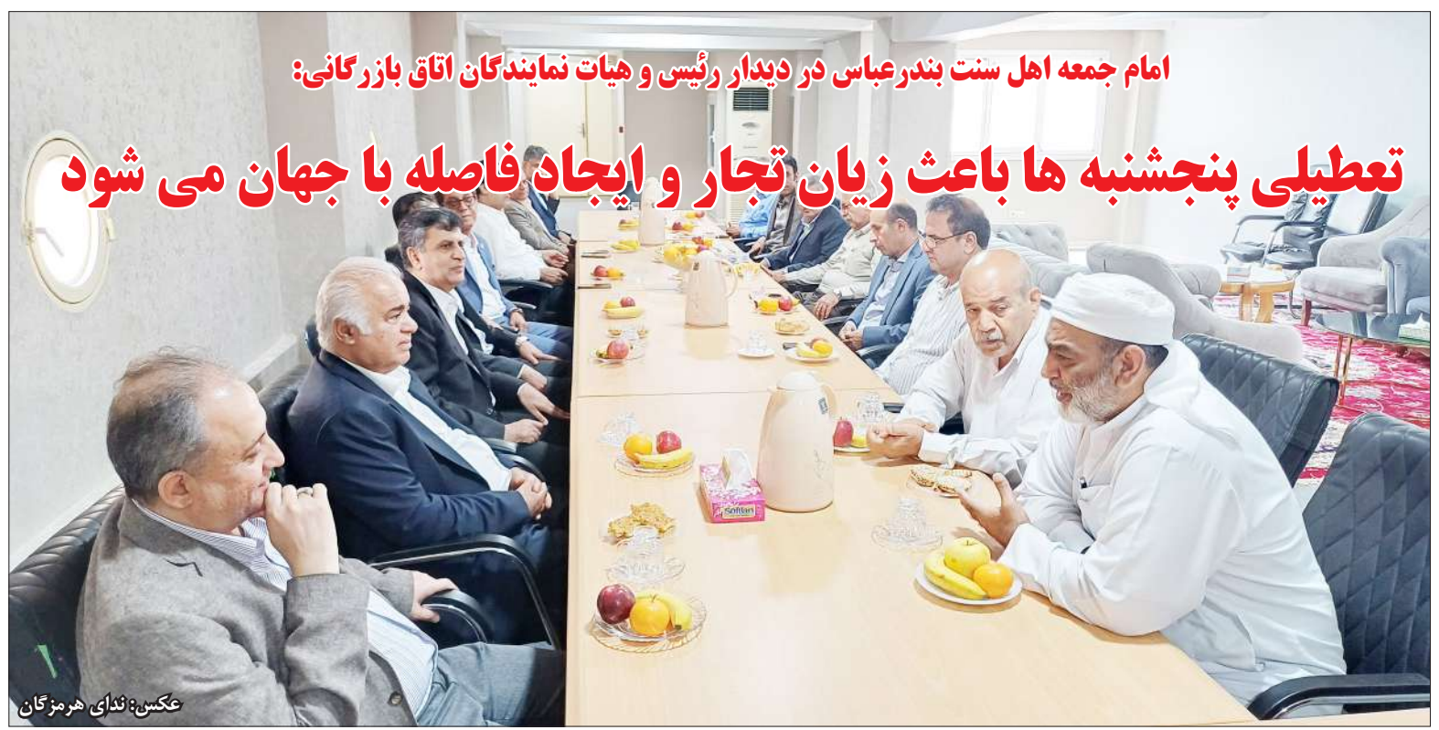
امام جمعه اهل سنت بندرعباس در دیدار رئیس و هیات نمایندگان اتاق بازرگانی: