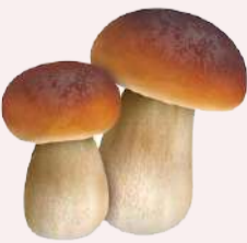
اینفو گرافیک: ندای هرمزگان / سی. عملایی

تقویت انرژی به دلیل وجود ویتامین های گروه B