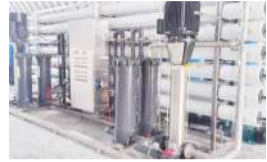
مدیرعامل شرکت آب و فاضلاب هرمزگان: