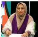
خبرگزاری. اباچی. نوروز. ۱۴۰۳ فربیا کریمی. (اثر دخت)

گاهی دیده شده ته مانده آجیل ها ، که ما باشیم، تا سیزده به در خورده نشده و بعنوان آجیل سیزده به در برده شده و در نهایت با سبزه سیزده بدر دور ریخته می شویم!