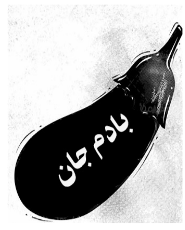
زیر نظر: راشد انصاری (خالو راشد)