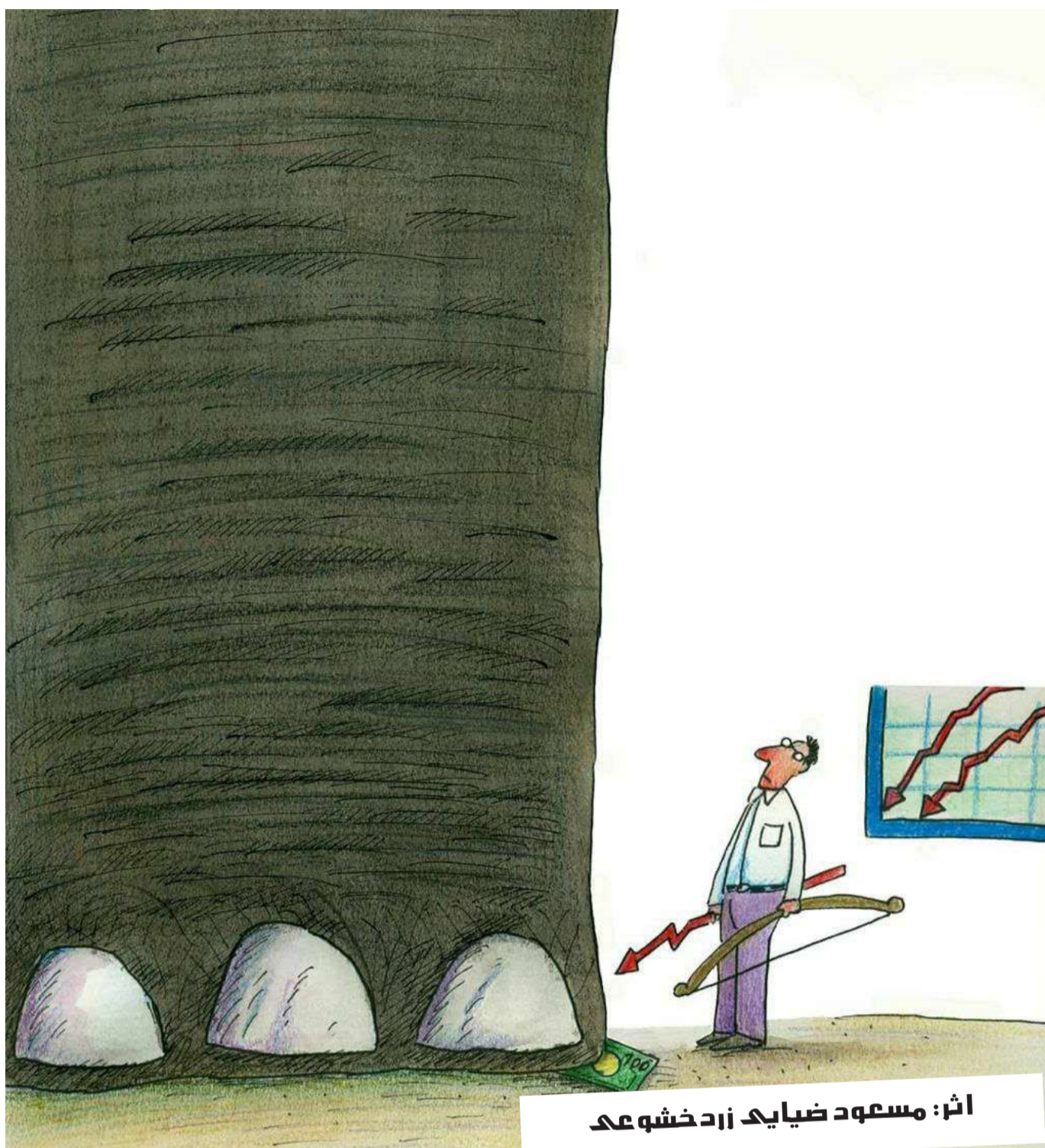
اثر: مسعود ضیایک زردخنده