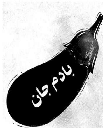
زیر نظر: راشد انصاری (خالو راشد)