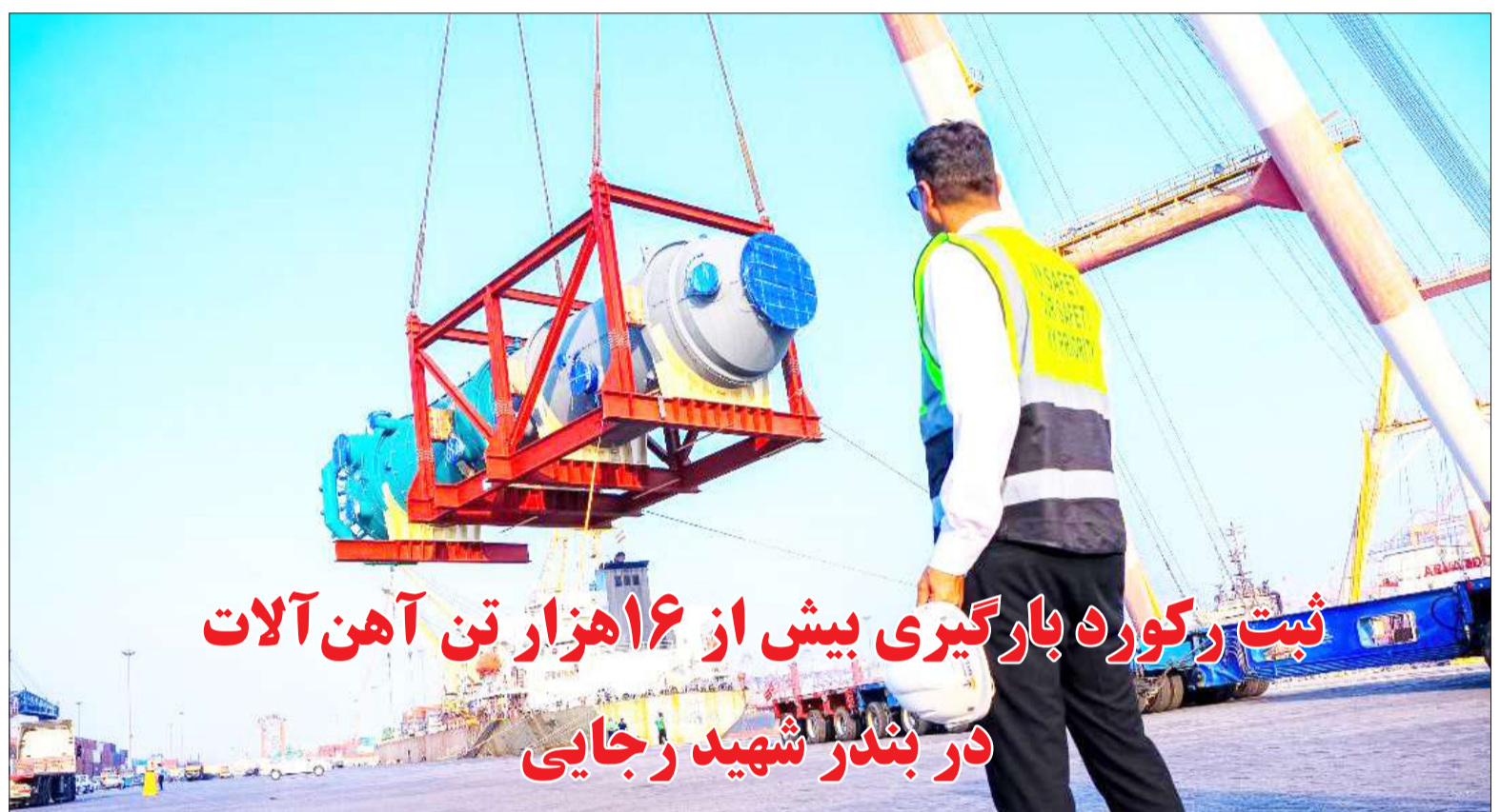
ثبت رکورد بارگیری بیش از ۱۶ هزار تن آهن آلات در بندر شهید رجایی

۹ بندر شهید رجایی تخلیه شد. مدیرکل بندر و دریانوردی هرمزگان اضافه کرد: امسال همچنین اسکله نگله‌های ۲۴۳ تن، ۲۰۰ تن و ۱۱۲ تن و نگله‌های ۱۸۲ و ۱۴۰ تن نیز در اسکله شماره ۱۰ بندر شهید رجایی تخلیه شد. «نگله» کلمه‌ای است به ظاهر هندی که در بندرها و گمرک‌های جنوب بسیار متداول است با این توضیح که به واحد کالاهای بسته بندی نشده مثل یک شاخه تیر آهن یا یک شمش فلزی سنگین و حتی به یک دستگاه اتومبیل یا تراکتور نیز که اقلام مانیفست و بارنامه یک واحد را تشکیل می‌دهند، نگله می‌گویند. وی با بیان اینکه این کشتی دارای ۱۹۰متر طول و ۵۰ هزار تن با ظرفیت بارگیری بوده است، بالاترین رکورد ثبت شده در این بندر را ۱۲ هزار و ۵۰۰ تن اعلام کرد. مدیر منطقه ویژه اقتصادی بندر شهید رجایی در بخش دیگری به تشریح عملکرد ۹ ماهه تخلیه نگله (محموله‌های فوق سنگین وارداتی) در بندر شهید رجایی پرداخت و افزود: در این بازه زمانی، نگله‌های سنگینی از جمله یک نگله ۳۵۹ تنی به طول ۳۰ متر، ۴۵ متر عرض در اسکله ۲۲ تخلیه شد. به گفته عباس‌نژاد: در دی‌ماه امسال نیز یک نگله ۱۱۵ تنی به طول ۲۵ متر با پنج متر ارتفاع در اسکله