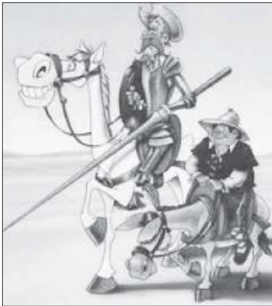
گردآورنده: راشد انصاری (خالو راشد)