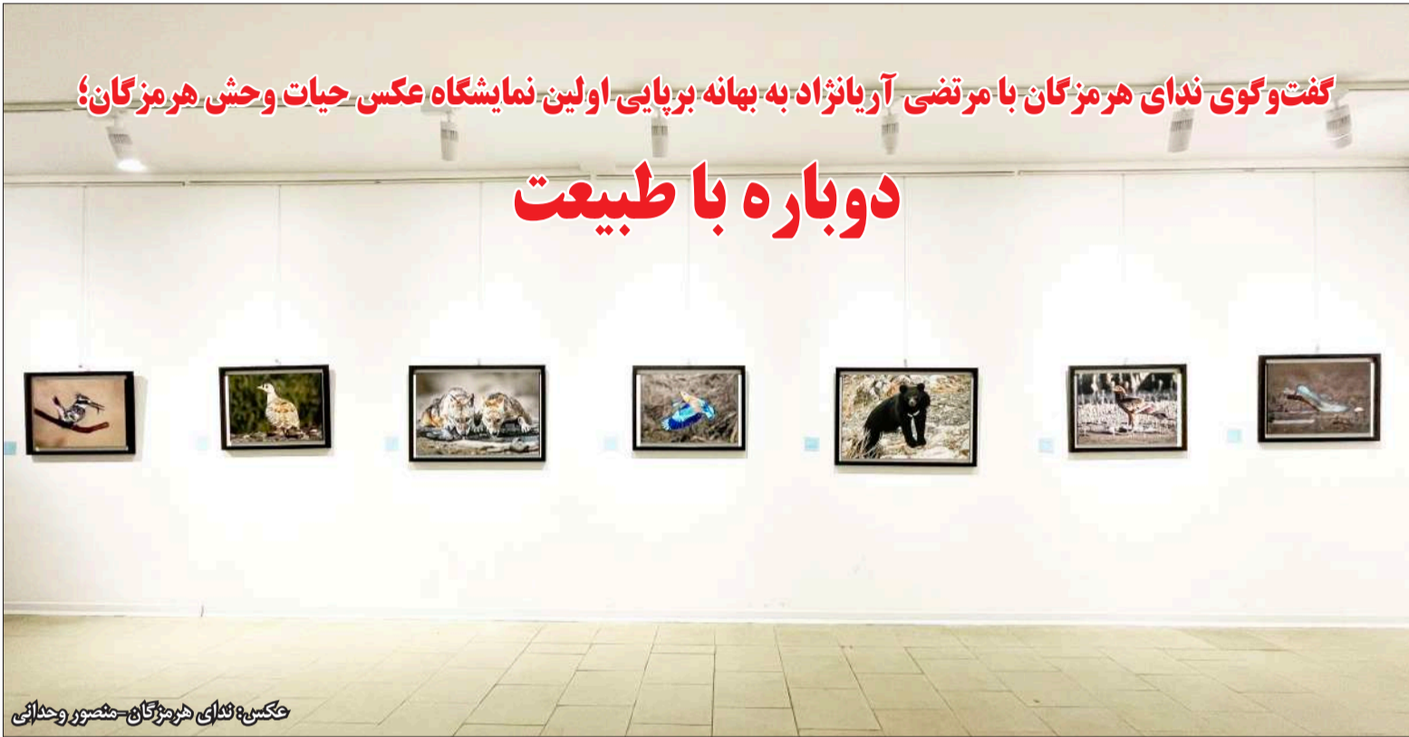
عکس‌های هنرمندان مشهور و هنرمانی