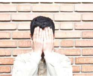
زنی سالخورده در خانه اش به قتل رسیده