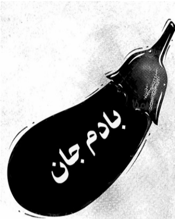
زیر نظر: راشد انصاری (خالو راشد)