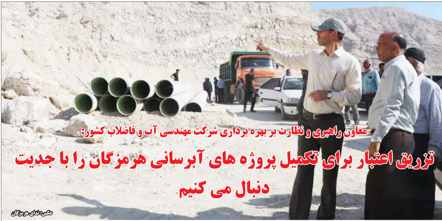
معاون راهبری و نظارت بر بهره برداری شرکت مهندسی آب و فاضلاب کشور: