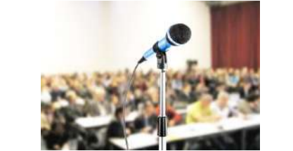
رئیس کمیته امداد شهرستان حاجی آباد بیان کرد: از ابتدای سال تا کنون تعداد ۱۱۰ سری

نتایج تحقیقات نشان می‌دهد که با بیش از هر زمان دیگری به زنان و تأثیر آنها بر دنیای خود با توجه به مقیاس چالش‌های پیش رو نیاز داریم.