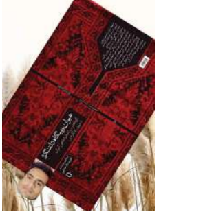
هیران و بیگاه دلتنگی، روانه بازار کتاب شد. این کتاب ۱۱۰تومان قیمت دارد.

دیهو معادل اشعار شفاهی دیگر فرهنگ‌های مناطق ایران است، ترانه‌ها و اشعاری با سادگی تمام که از هر نوع عبارت پردازی و تصنع به دور اند. این کتاب ۱۱۰ هزارتومان قیمت دارد.