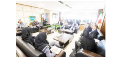
نماینده سازمان تجارت خارجی ژاپن (جترو) در تاشکند با مدیرکل بندر شهید رجایی دیدار کرد.

وی از بندرعیاس به عنوان نزدیک‌ترین و کم‌هزینه‌ترین مسیر برای فعالیت‌های تجاری برای سازمان تجارت خارجی ژاپن(جترو) در تاشکند نام برد و خاطرنشان کرد: با توجه به اینکه شرایط برای سرمایه‌گذاری شرکت‌ها در ایران باز بوده، توجه ما به توسعه تجارت و سرمایه‌گذاری با بندر شهید رجایی بیشتر شده است.