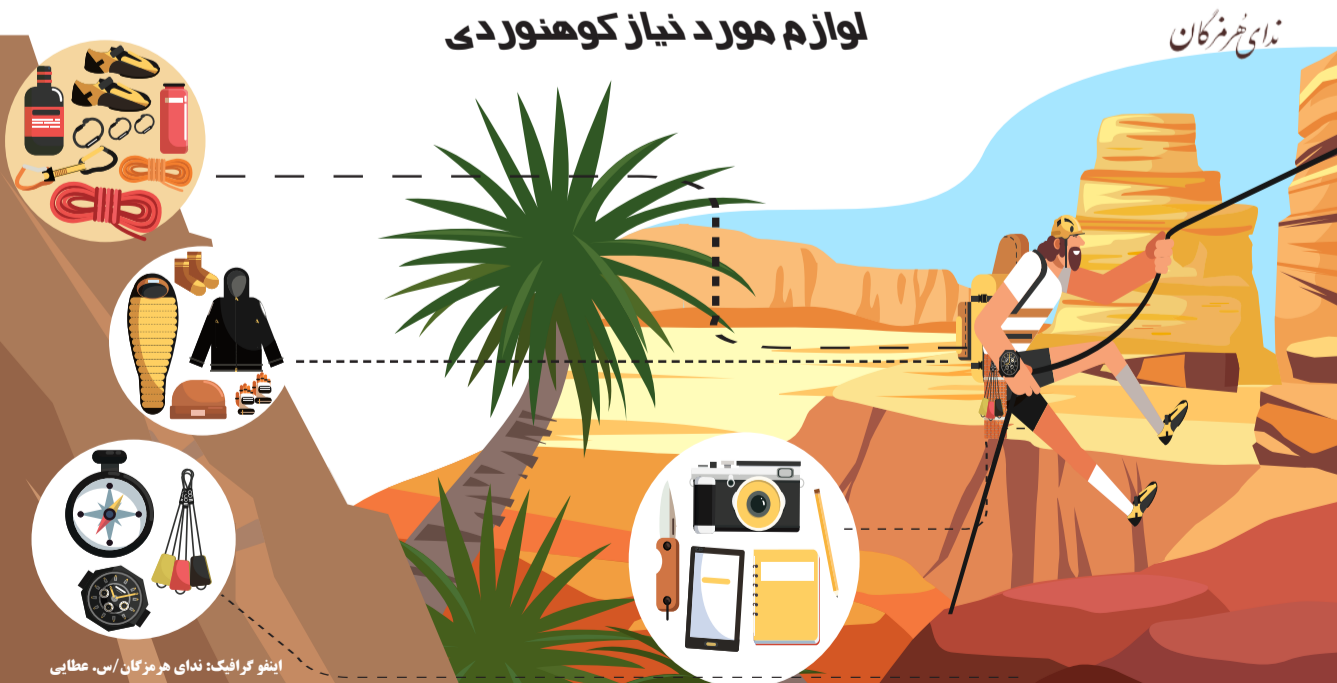
اینفو گرافیک: ندای هرمزگان/س. عطایی